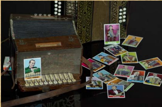
La Boîte à Frissons